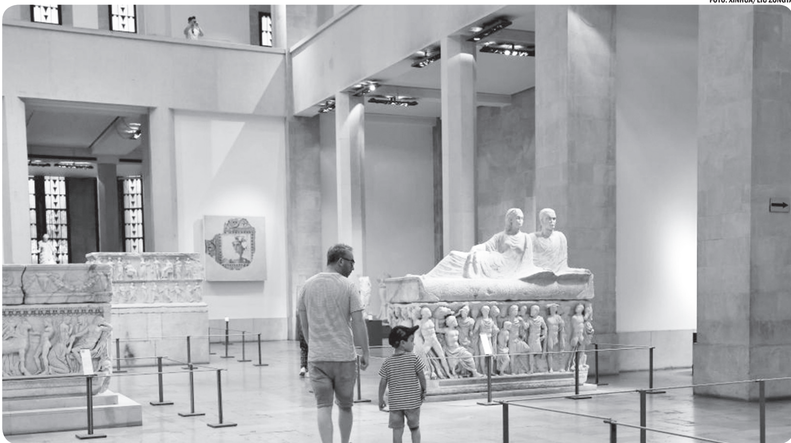
TURIS KUNJUNGI MUSEUM NASIONAL DI BEIRUT

Turis mengunjungi Museum Nasional di Beirut, Lebanon, pada Selasa (1/8).